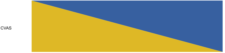
*CVAS: Colored Visual Analogue Scale

إذا لم يساعدك طبيبك المعالج يمكنك أن تراجع قسم التخدير في المستشفى وسيكون فريقه في خدمتك دائماً.